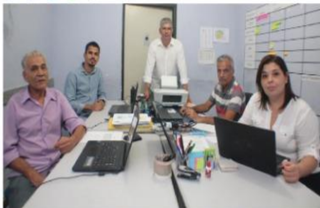
A equipe já iniciou as metas para a fazer a revisão do Plano Diretor Participativo. (Cláudio Nunes/PAZ)Z

A Prefeitura de Belford Roxo realiza no dia 20 de setembro, a partir das 9h no auditório da Unilabex, um seminário para apresentação do Plano de trabalho do Plano Diretor Participativo. Entre os principais temas debatidos estarão saneamento básico e mobilidade urbana. O novo plano deverá entrar em vigor em 2021 e terá validade de 10 anos. O Plano Diretor Participativo – que é exigência do Governo Federal – é um conjunto de princípios e regras orientadoras de ação dos agentes que constroem e utilizam o espaço urbano.